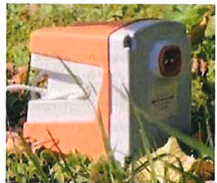
GÉOPHONE Boîtier de 11 x 11cm

Les géophysiciens reconstituent ensuite l'image du sous-sol, à partir de l'analyse des signaux enregistrés.