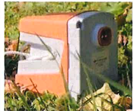
GÉOPHONE Boîtier de 11 x 11cm

Les géophysiciens reconstituent ensuite l'image du sous-sol, à partir de l'analyse des signaux enregistrés.